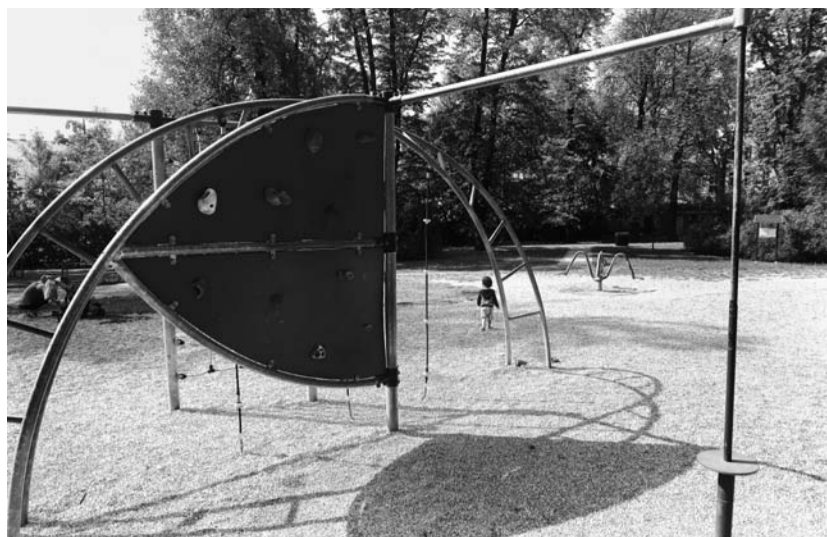
Jdete s dětmi na hřiště, ale nemůžete se zdržet, protože u něj nejsou toalety. Alespoň v Olomouci, v jiných městech to totiž jde. Příklad z Čechových sadů.