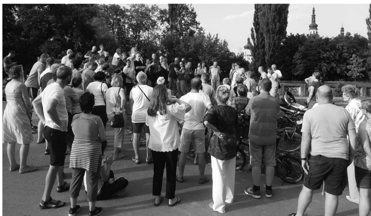
O setkání na Letné byl velký zájem. Místní nejvíc zajímalo, co se má stavět na poli u ulice Dlouhá. Olomoucký kraj tam chce vybudovat centrum prevence. Hnutí ProOlomouc požaduje, aby jeho okolí zůstalo průchozí.