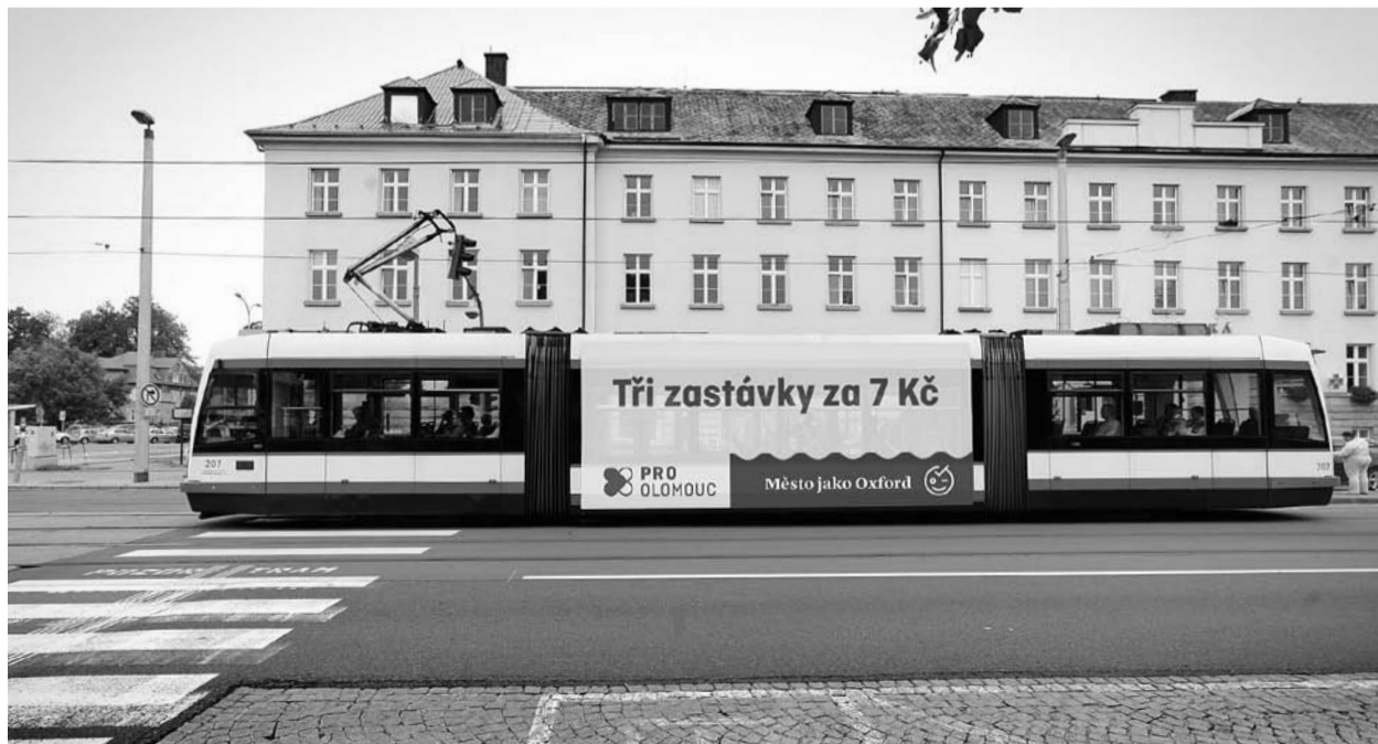
Tři zastávky ujedete za 7 korun, platnost jízdenky za 14 korun prodloužíme ze 40 na 60 minut.

Tomáš Pejpek, zastupitel, kandidát na primátora